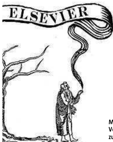
Mit diesem veränderten Logo des Verlages Elsevier rufen Studenten zum Boykott auf

Nun, nach all den Jahrhunderten ungebrochener Macht, scheint sich tatsächlich etwas zu ändern: Institutionen wie die Max-Planck-Gesellschaft fördern offene Publikationswege, Großbritannien kündigte an, alle Forschungsergebnisse, für die der Steuerzahler Geld ausgibt, bis 2014 im Internet kostenlos zugänglich zu machen, die EU-Kommission hat Ähnliches vor.